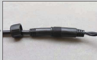
2. 奥まで差し込みます。