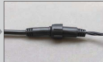
3. しっかりと締めます。